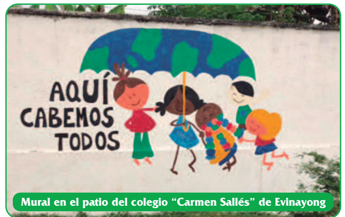
Mural en el patio del colegio "Carmen Sallés" de Evinayong

En definitiva, gracias a este proyecto se lograrán personas mejor formadas y ganar en la calidad educativa del país, a través de su alumnado y de la atención a las familias.