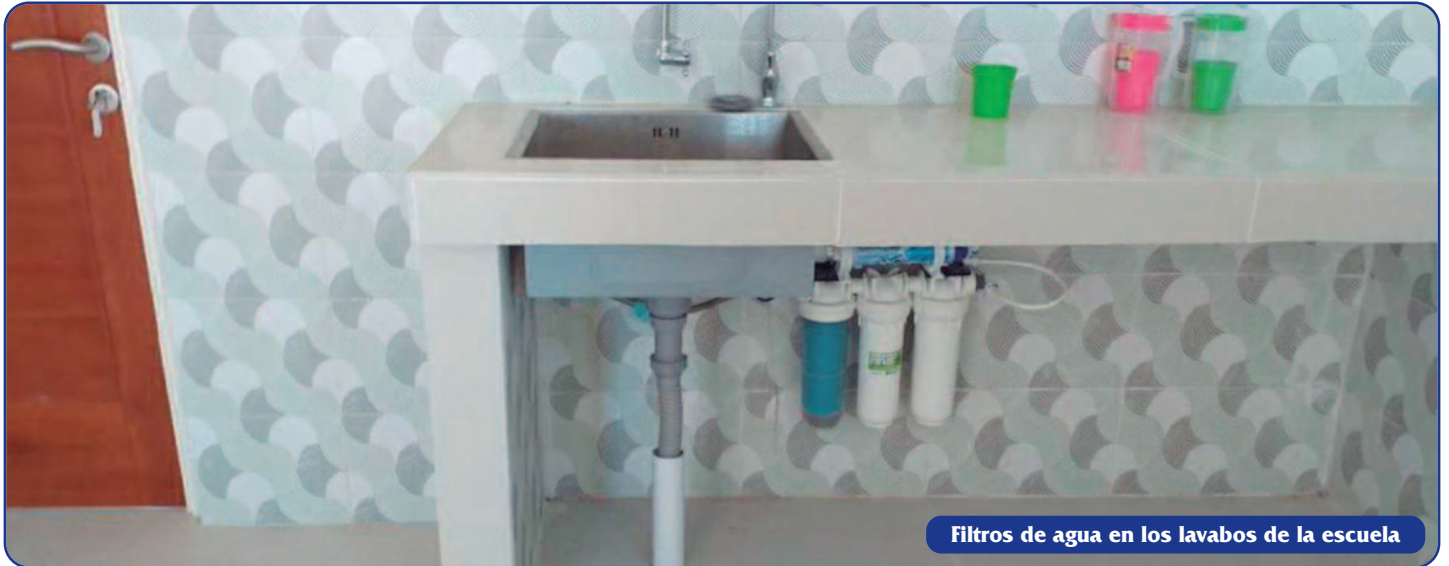
Filtros de agua en los lavabos de la escuela